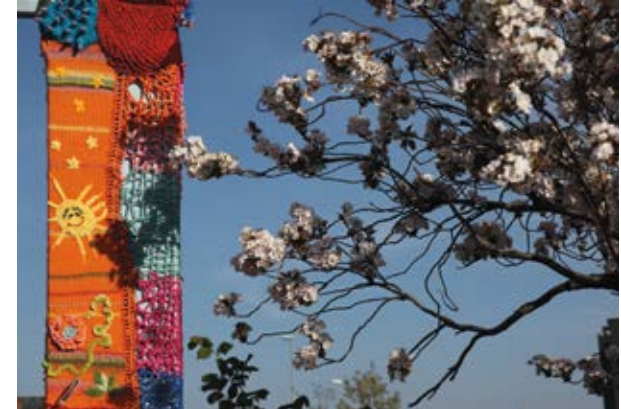
Strik på Klapbroen af kunstnergruppen Stickkontakt i forbindelse med udstillingen Walk This Way i 2011