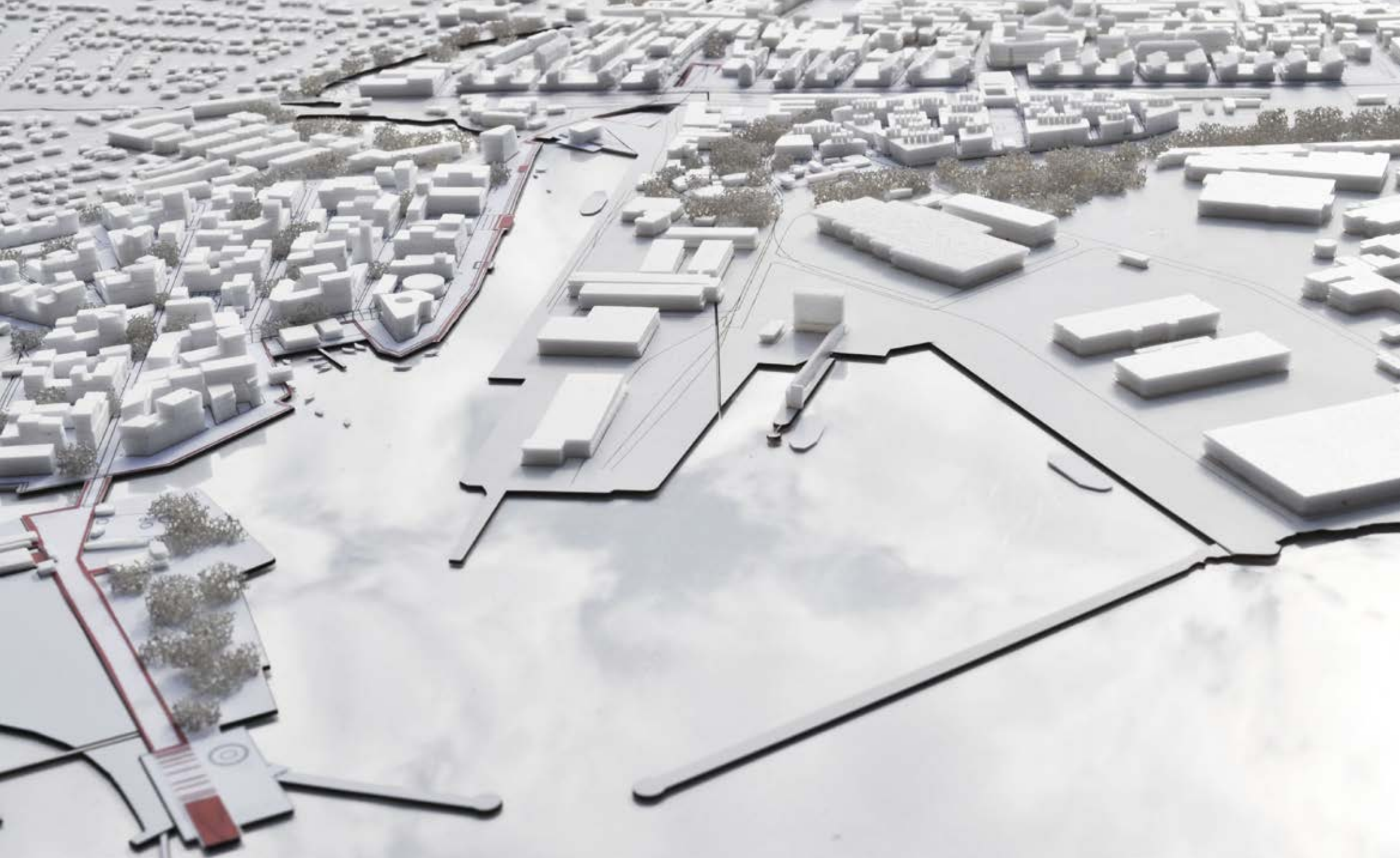
Fysisk model af Køge Kyst projektområder. Til venstre ses den nye bebyggelse på Søndre Havn. I baggrunden ses de nye bebyggelser i Stationsområdet og på Collstrup, samt broen og underføringen, der er med til at binde byen tættere sammen og vende byens ansigt mod vandet. Udarbejdet af Tegnestuen Vandkunsten A/S.