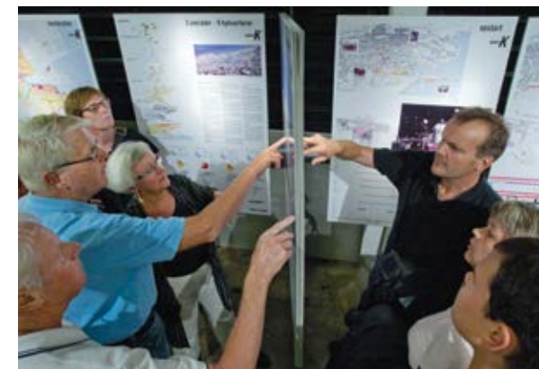
Eksempler på dialogmøder afholdt af Køge Kyst.