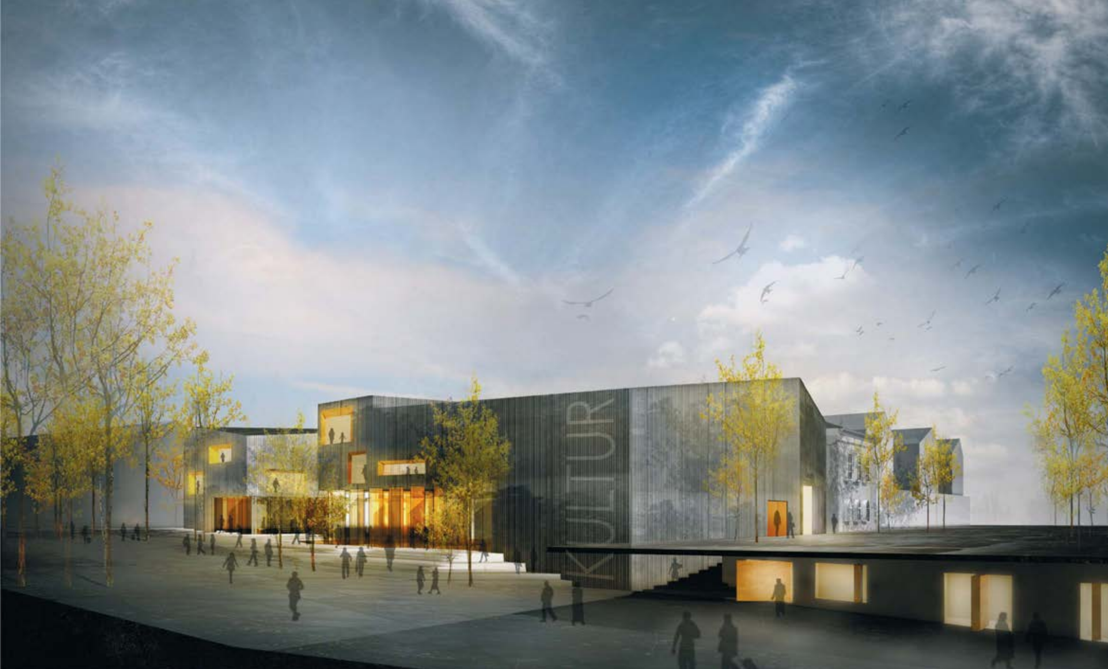
Visualisering af Køges nye kulturhus ved Underføringen. Udarbejdet af Lundgaard & Tranberg Arkitekter A/S.